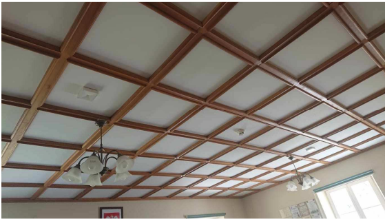
demontaż istniejącego nabitego rusztu drewnianianego